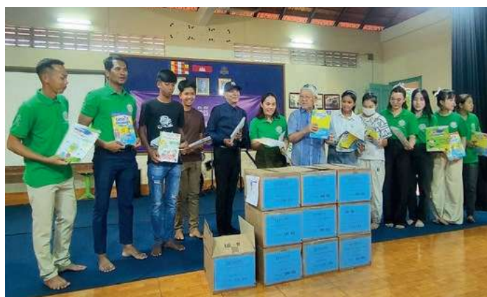
Cambodge, MJC Kampot.