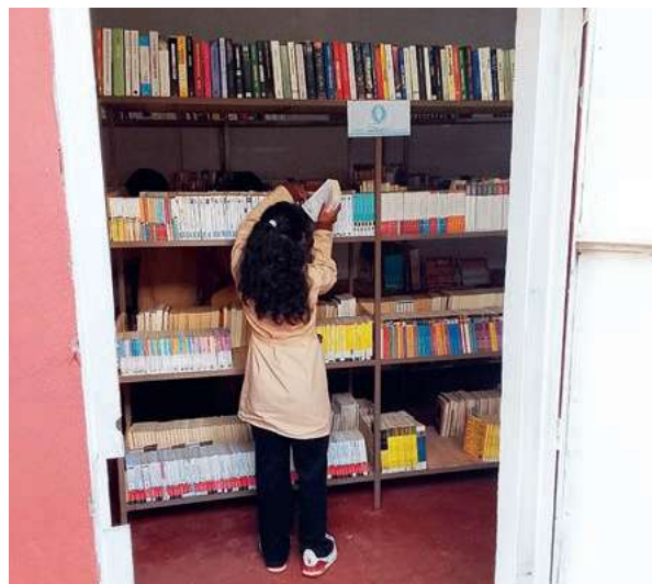
Madagascar, Lycée Raombana.

Madagascar 3, Solidarité laïque : « La rentrée solidaire à laquelle vous aviez apporté votre contribution en livres, a bien eu lieu : 10 000 élèves