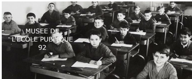
Photo du musée

(M) 13 (BUS) 138, 166, 178, 235 (RER) C (avec navette)