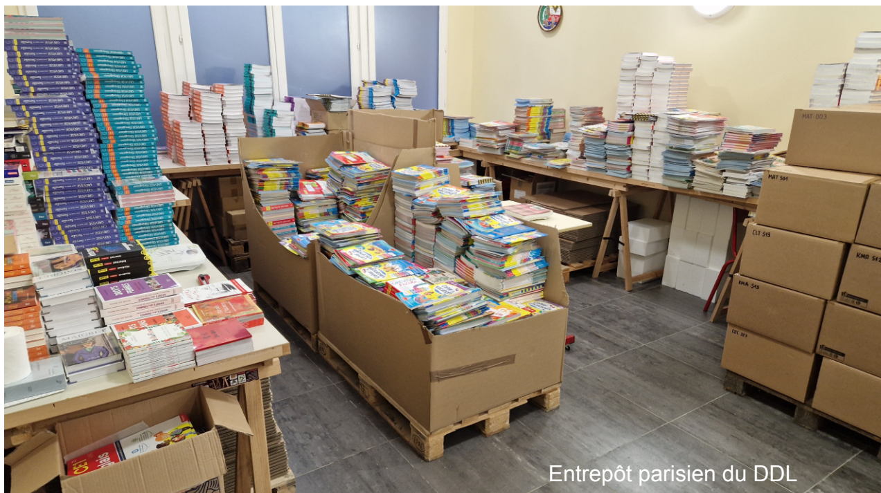
Entrepôt parisien du DDL