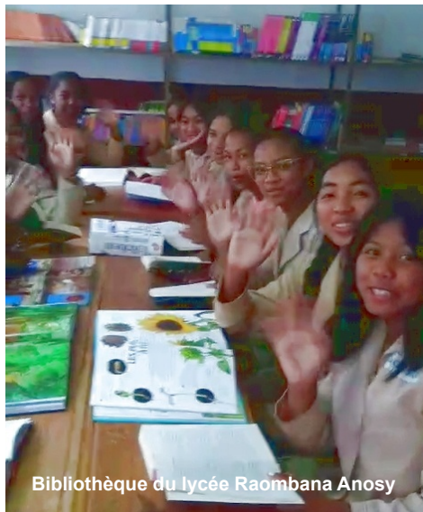
Bibliothèque du lycée Raombana Anosy

Une nouvelle Maison est en construction à Ebolowa d'où notre double don de 2023 : le premier pour la Maison de Yaoundé et le second pour inaugurer celle d'Ebolowa. L'AMOPA peut s'enorgueillir de participer à cette création.