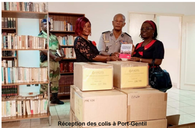
Réception des colis à Port-Gentil

Le réseau RIMF nous a informés du projet de la municipalité de Port-Gentil d'ouvrir un Espace de la francophonie dans sa nouvelle Maison des jeunes. L'AMOPA ne pouvait