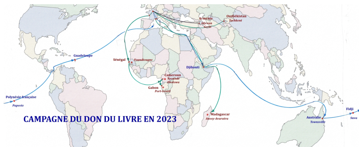
CAMPAGNE DU DON DU LIVRE EN 2023