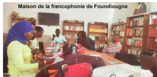
Maison de la francophonie de Foundiougne