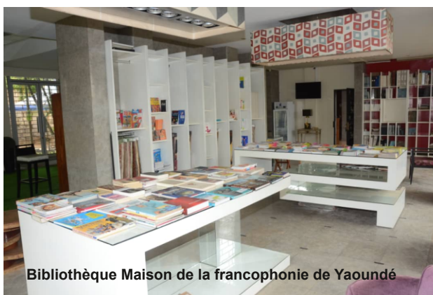
Bibliothèque Maison de la francophonie de Yaoundé

Trois colis ont été remis à l'association Coopération-Arménie. Suite à l'attaque du Haut Karabakh, les difficultés ont été telles qu'ils ne transiteront qu'après la parution de cet article, cependant, d'autres ouvrages qui avaient été donnés au centre Tteni de la ville de Goris ont été appréciés comme un signe d'amitié qui les a émus. « Transmettre des ouvrages en langue française à une association de la ville de Goris dans la région de Syunik, c'est exprimer une forme de reconnaissance. C'est reconnaître que les habitants de cette belle ville aux étonnantes cheminées de fées éprouvent une vive prédilection pour la langue française »