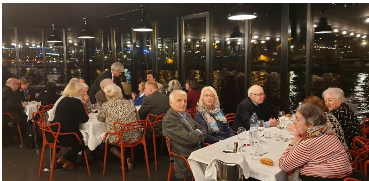
Après les rafraîchissements de fin d'AG, un dîner au bord de la Seine