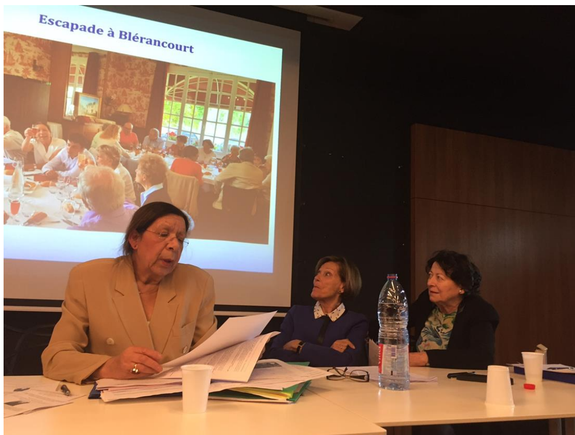
Le rapport d'activité par Rose-Marie Wilbert