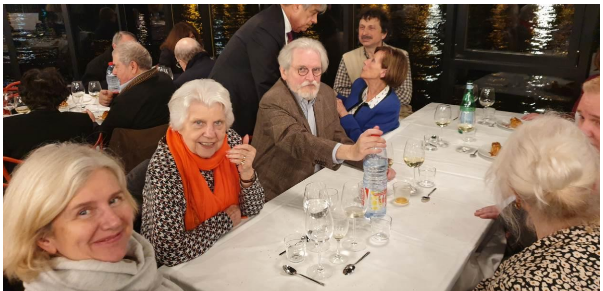
Quelques autres plus dissipées...