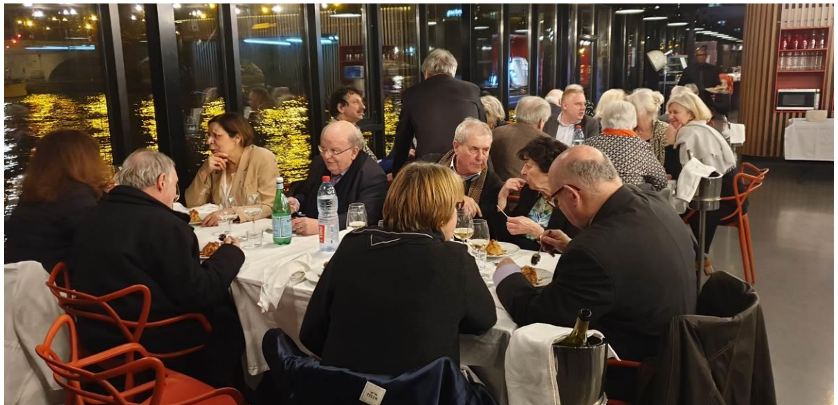
Des tablées raisonnables