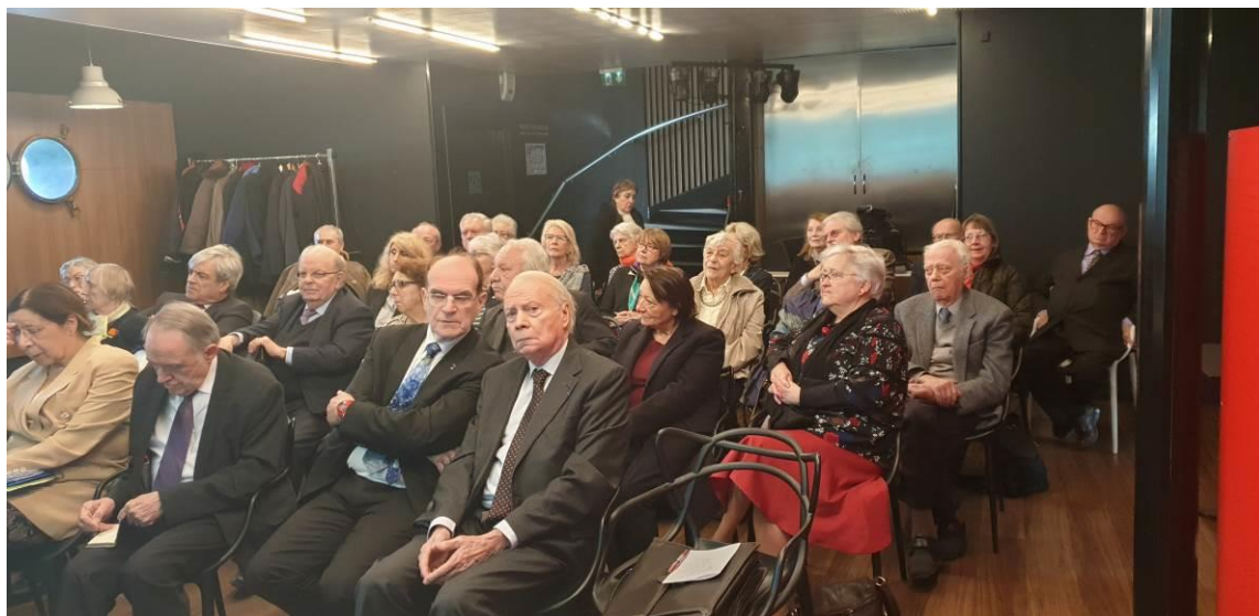
Une assemblée généreuse