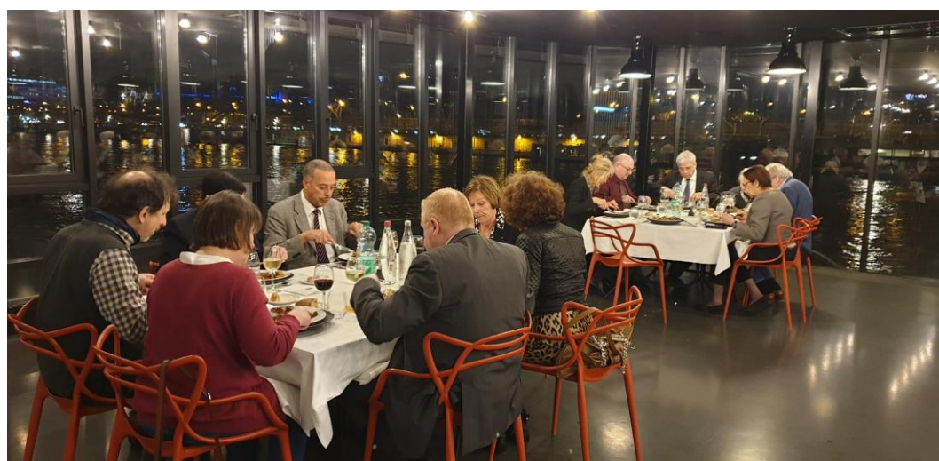
avec un menu apprécié, accompagné par le trafic fluvial,