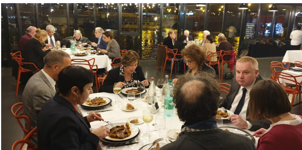
Il fut suivi par un dîner servi au bord de la Seine,