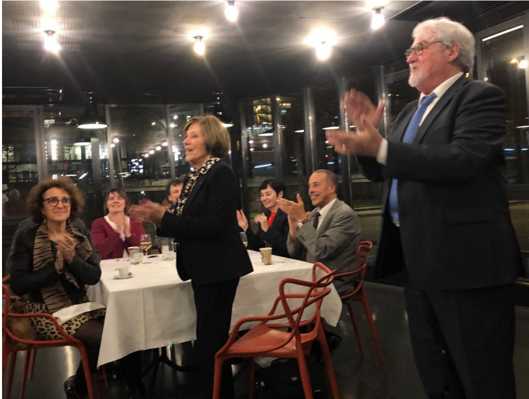
il suscita les applaudissements de l'assemblée pour remercier ses hôtes