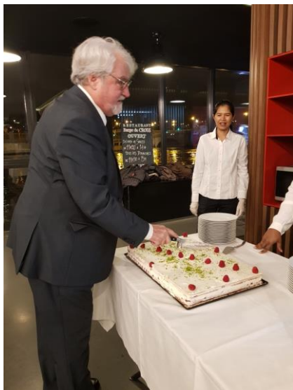
et pour le dessert, le président fut mis à contribution !

Nous vous remercions vivement de votre présence, de votre attention, de votre convivialité et vous attendons en 2021 !