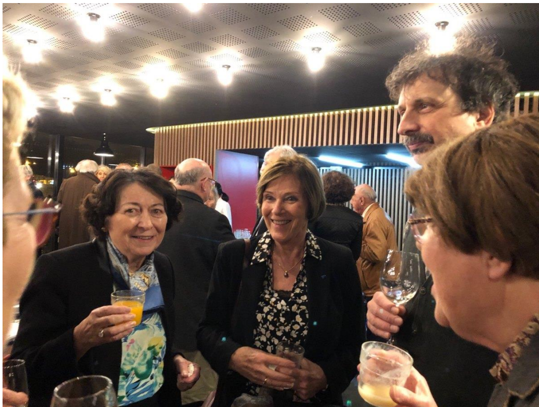
Après les rafraîchissements de fin d'AG un cocktail permet de se rafraîchir